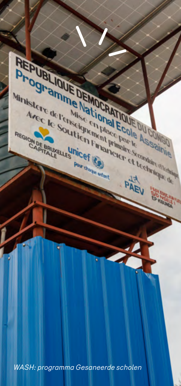
WASH: programma Gesaneerde scholen