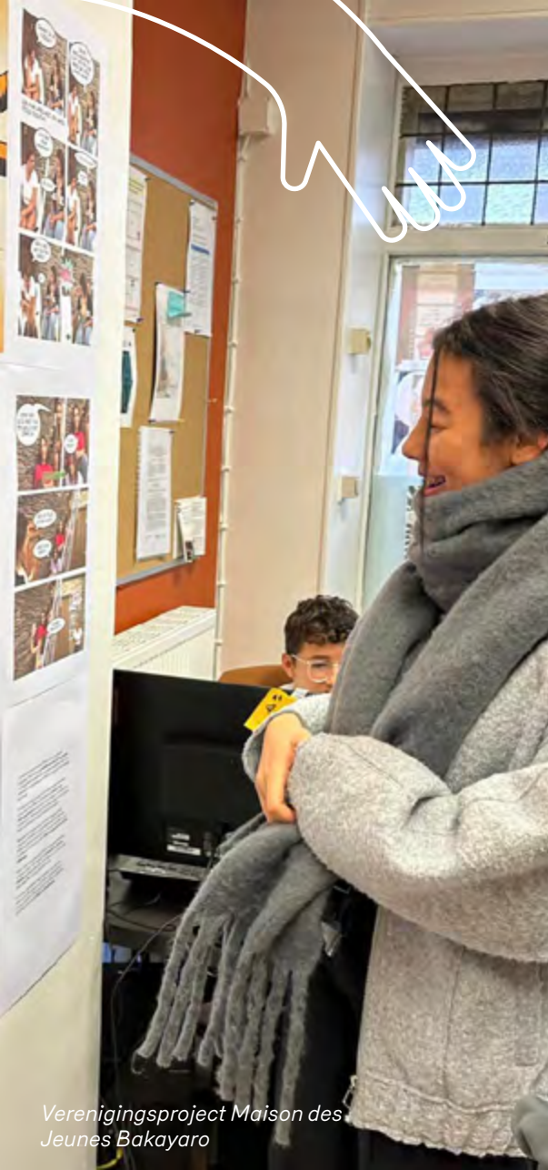
Verenigingsproject Maison des Jeunes Bakayaro